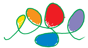
Biosphärenpark Großes Walsertal